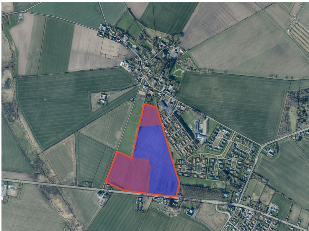
Figur 1 Oversigt over spildevandstillæggets oplande. Rødt opland nedsiver regnvand, mens blå opland afleder regnvand til recipient.

Spildevand transporteres til rensning på Nyborg Centralrenseanlæg og Kerteminde Renseanlæg. På sigt vil al spildevand blive ledt til rensning på Kerteminde Renseanlæg.