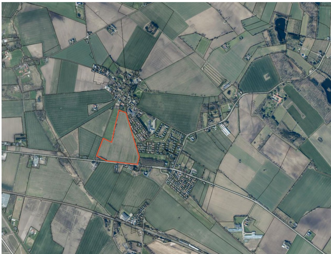
Figur 1: Oversigtskort, lokalplanområde.

Der ønskes etableret ca. 175 nye boliger i området ved matrikel 1i Marslev By, Marslev angivet nedenfor.